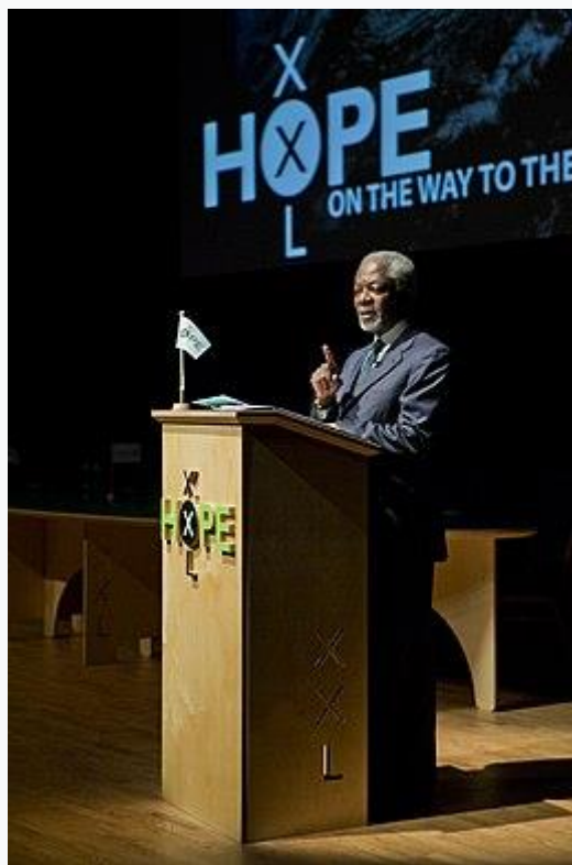
Kofi Annan spreekt op HOPE XXL conferentie in de Stadsgehoorzaal