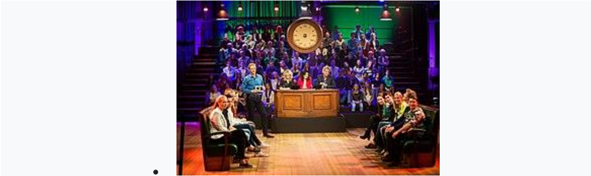
Finale Op Weg naar het Lagerhuis met de Vara 2015

HOPE XXL organiseerde vanaf 2013 tot en met 2019 in samenwerking met de VARA en 250 middelbare scholen en 2500 leerlingen uit alle provincies het programma "Op weg naar het Lagerhuis".