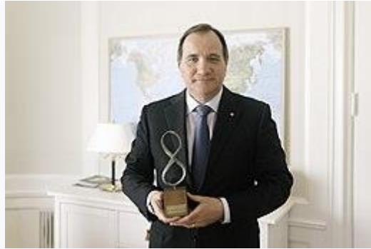
Stefan Löfven, premier Zweden met de HOPE XXL CUMULA

HOPE XXL staat voor Human Odyssey of People's Elevation . In 2009 kwam een groep bestaande uit tien jongeren (X) tien keer (X) bij elkaar in de regio de Liemers (XXL) om te filosoferen over een betere wereld, een oktopische samenleving waarin iedereen zijn of haar leven als goed (cum laude, met een 8) kan waarderen. De groep en het aantal bijeenkomsten zijn door blijven groeien. Wereldwijd hebben, gedurende een periode van vijf jaar, duizenden jongeren en honderden nationale en internationale prominenten en professoren meegedacht en meegepraat over de doelstellingen van HOPE XXL. De thema's waren sociale, economische en ecologische duurzaamheid, duurzame vrede en veiligheid en internationale samenwerking.